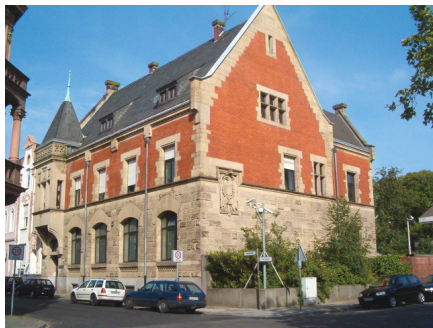
Reichsbank Viersen VIERSEN, Poststraße 8