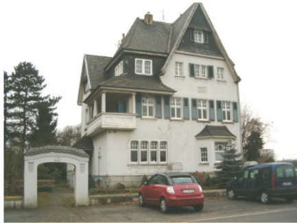
Villa Maria VIERSEN, Gladbacher Straße 779