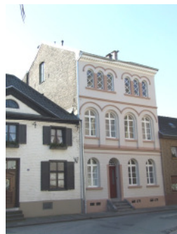
Villa und Hinterhaus Max Klingen DÜLKEN, Kreuzherrenstraße 59/ Ostwall 42