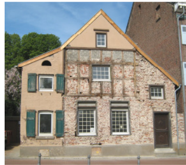
Mostertshaus DÜLKEN, Eligiusplatz 4/6