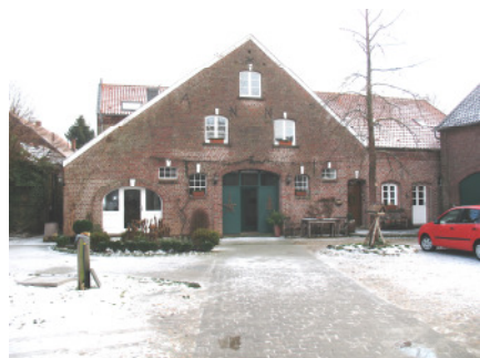
Dahlhof SÜCHTELN, Zerresweg 52