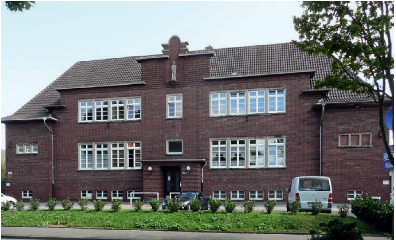
26. Viersen-Dülken, Bodelschwingstraße 126, ehem. Landwirtschaftsschule.